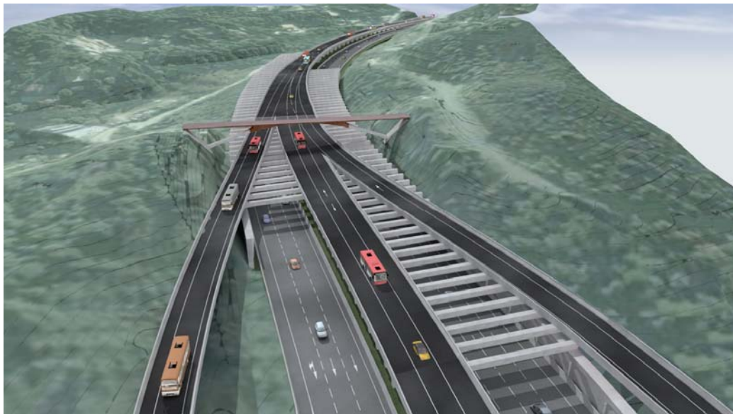
Imatge virtual de l'enllaç a Ripollet

d'uns 300 metres, descendirà aleshores per deixar el carril bus a nivell d'autopista i continuar cap a Barcelona pel centre de la calçada. L'enllaç conformarà també unes pèrgoles per damunt dels vials existents.