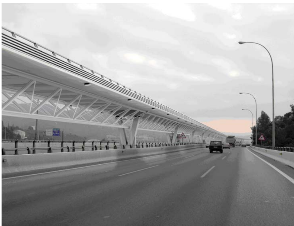
Imatge virtual del viaducte