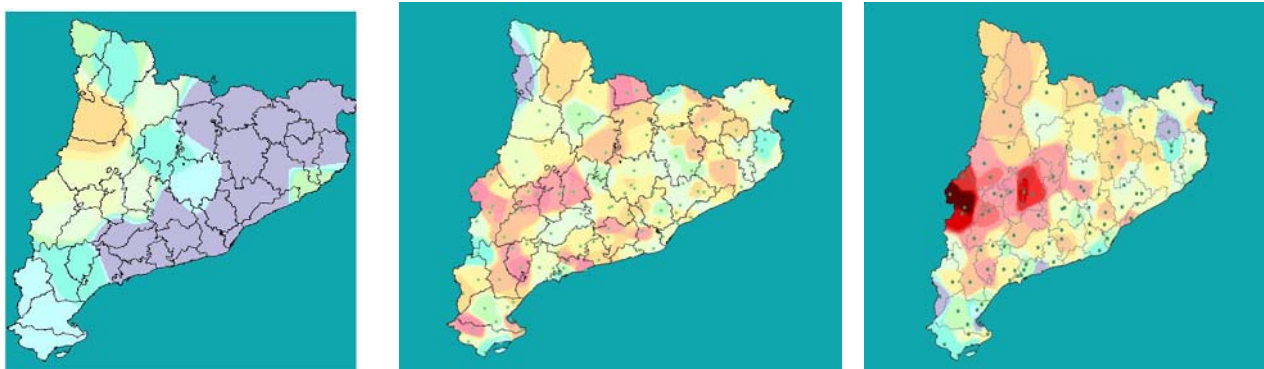
Mapes de sequera dels anys 2006, 2007 i 2008

Segons el mapa de sequera i de pluges, les zones especialment vulnerables al risc d'incendi són les comarques de la Catalunya central, el Prepirineu i els Pirineus. La resta de territori, gràcies a les pluges que hi han caigut les darreres setmanes, no presenta una situació tant crítica, tot i que igualment continua en risc.