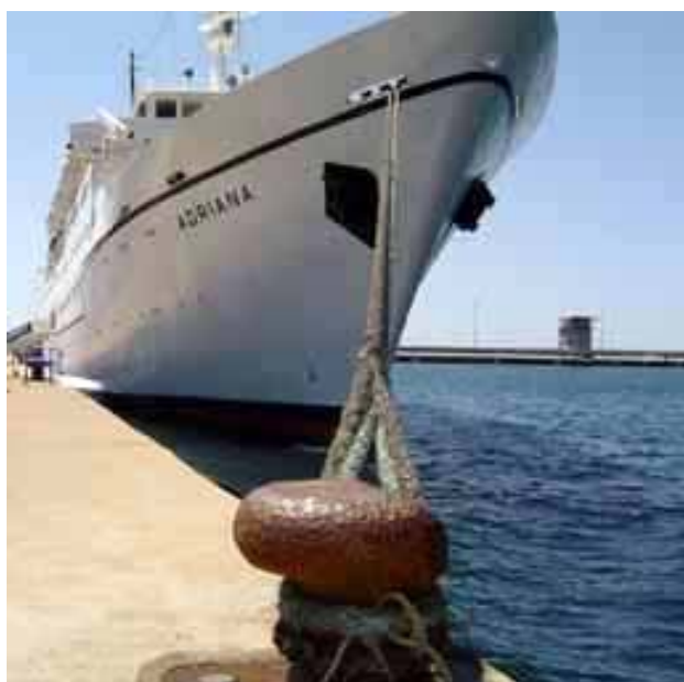
L'Adriana amarrat a Palamós

El vaixell Adriana es va construir l'any 1972, té una eslora de 103,71 metres i un calat de 5,5 metres. Un vaixell que ofereix un gran confort als passatgers amb piscina, restaurant, salons i sala de lectura.