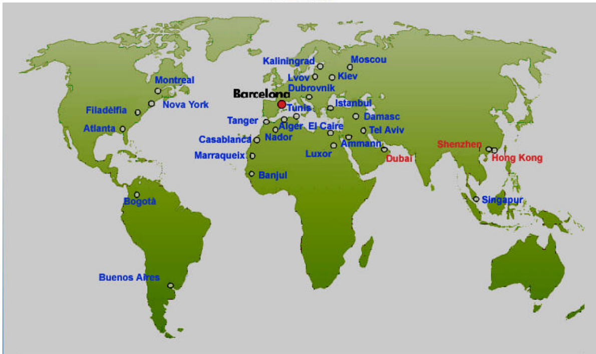
Rutes internacionals des de l'aeroport de El Prat amb vols directes de passatgers (en blau) i de càrrega (en vermell)