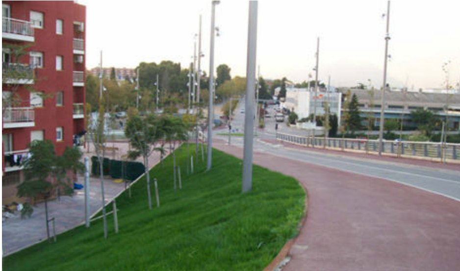
Imatge del carrer Nou Montserrat i la nova rotonda

El projecte ha inclòs també el condicionament dels marges del torrent dels Llops, que ha comportat la construcció de murs de contenció. A més, s'han reurbanitzat els carrers contigus, amb la renovació del paviment i les voreres, i la instal·lació d'un nou enllumenat. En aquest sentit, el carrer Nou de Montserrat disposa ara de noves zones enjardinades i baranes de seguretat al costat del torrent.