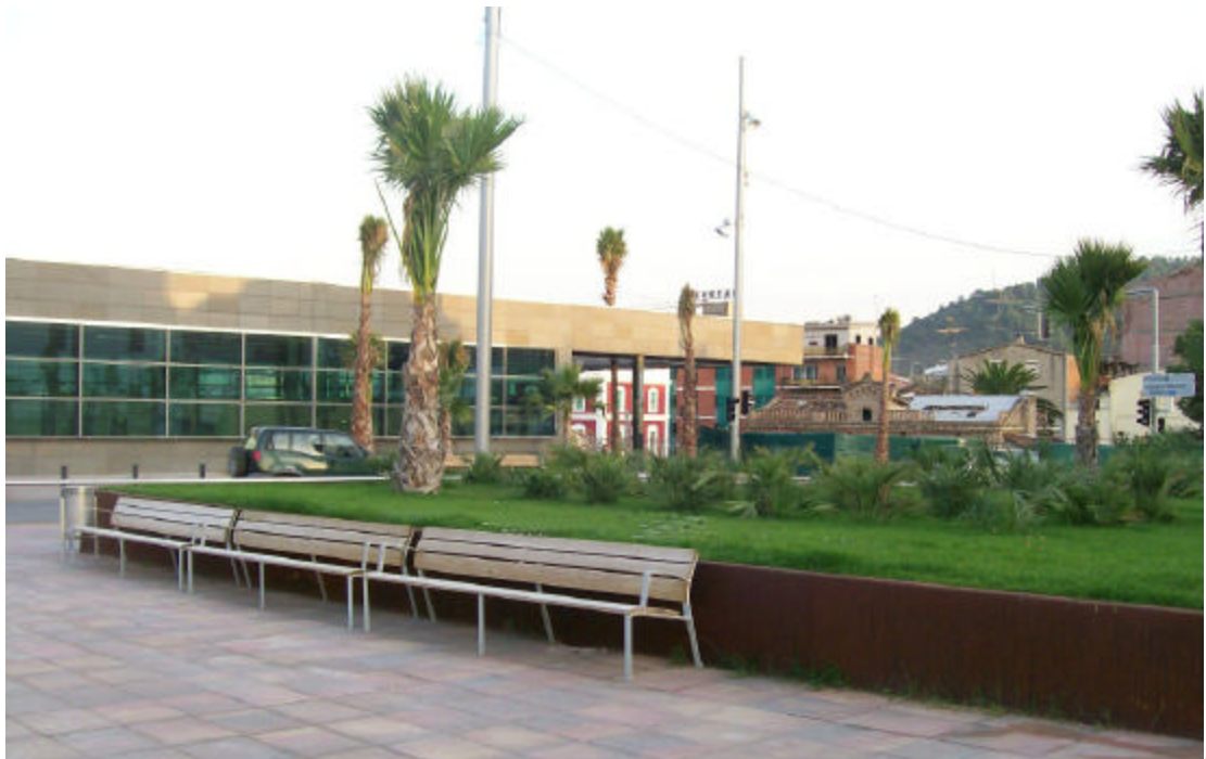
Imatge de la nova plaça davant de l'estació