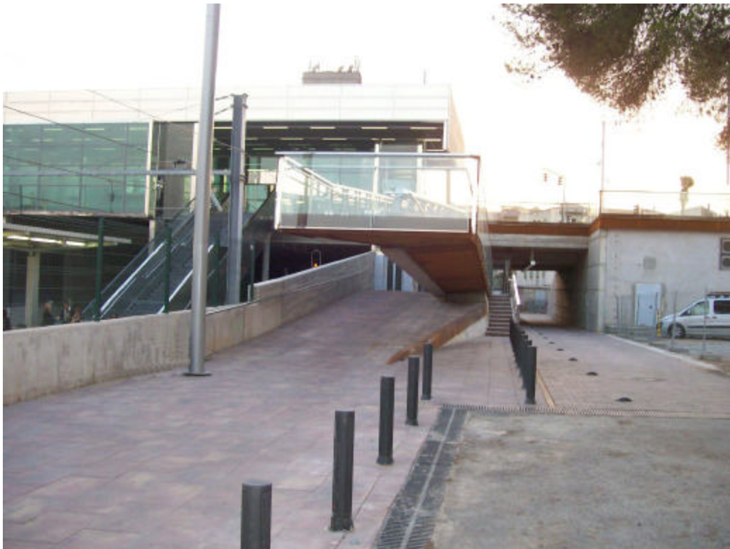
Nou pas inferior a l'antic carrer de Montserrat