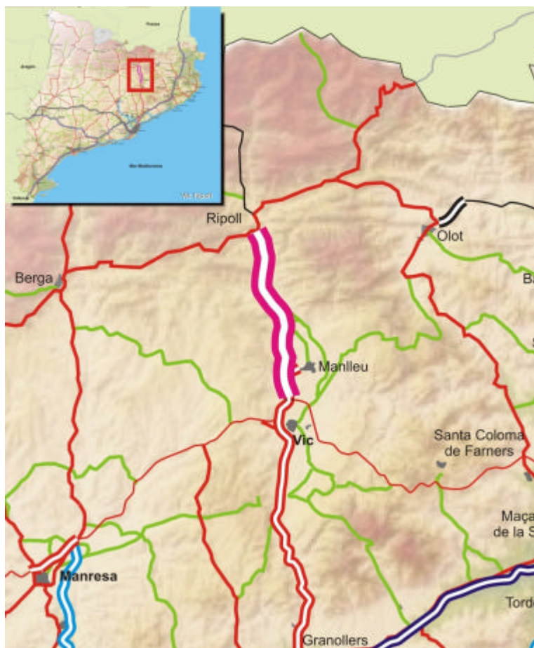
Tram de la C-17 que es desdoblarà