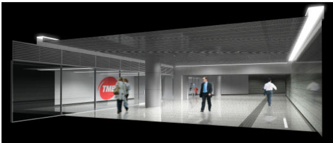
Vista de la zona del nou pas de correspondència de Diagonal L5