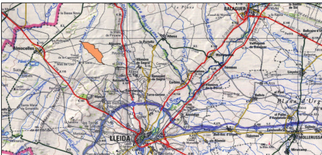
Ubicació de l'aeroport i la seva àrea d'influència

A més de les dimensions de la pista de vol, el Pla especial defineix les dimensions de les servituds aeronàutiques. Aquestes zones tenen l'objectiu d'afavorir la seguretat i regularitat de les operacions de l'aeroport i garantir la seva viabilitat a llarg termini, a més de protegir l'entorn de les afeccions que l'activitat aeroportuària pugui produir.