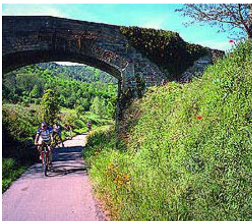
Via verda (Girona)