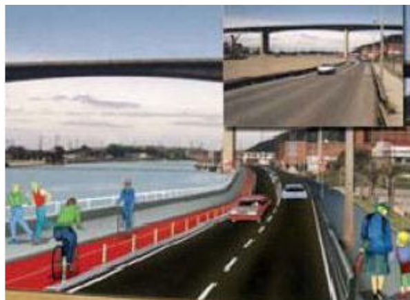
Imatge virtual carril segregat (Cantàbria)