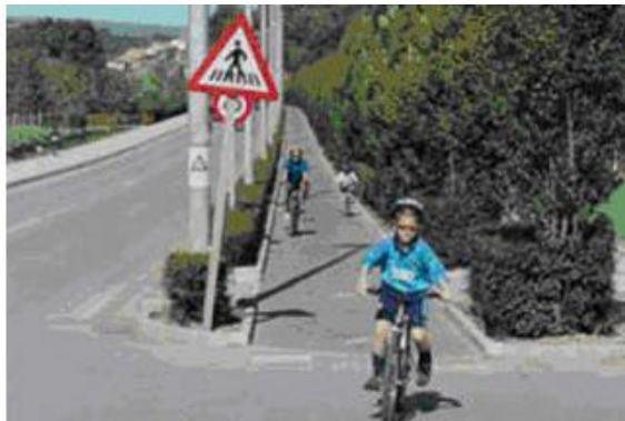
Exemples de carrils bici segregats (Madrid i País Basc)