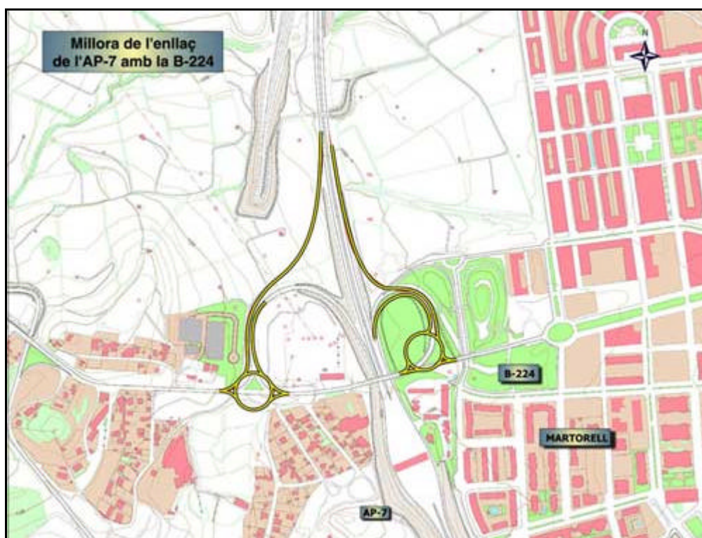
Millora de l'enllaç de Martorell entre l'AP-7 i la B-224

El pressupost de les obres és de 2,8 MEUR. Es preveu que s'iniciïn aquest any, amb un termini d'execució de 5 mesos.