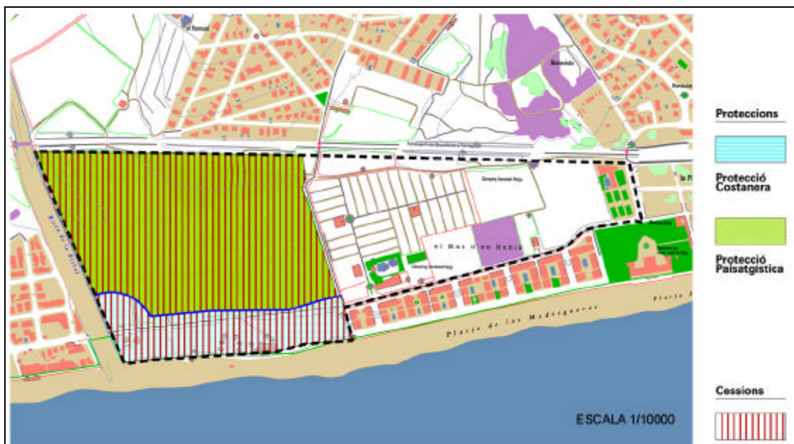
Exemple protecció PDUSC-2: Les Madriueres (El Vendrell)

(**) (Part d'aquests sectors es classifica com a sòl no urbanitzable costaner)