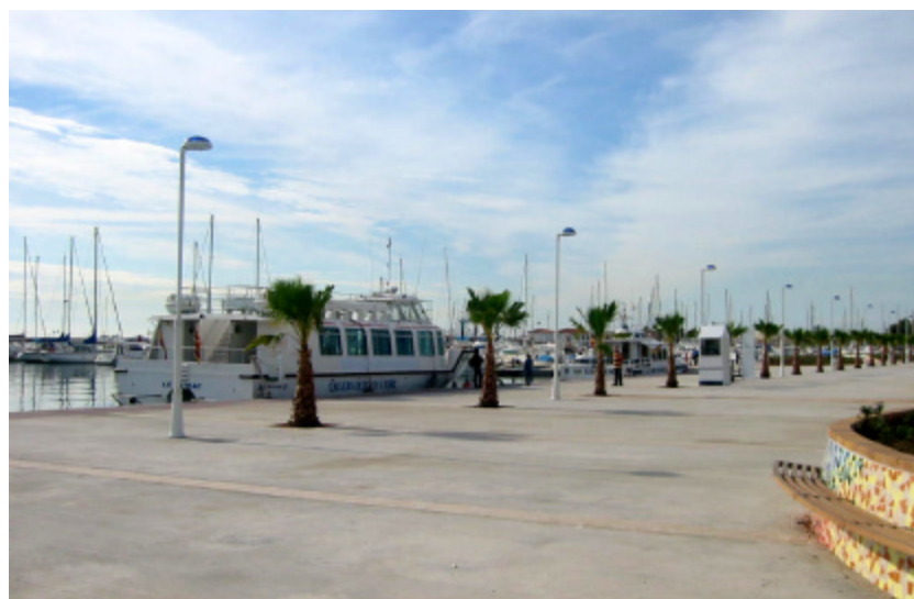
Nou moll de creuers, port de Sant Carles de la Ràpita

El Pla recull les actuacions prioritàries als ports comercials de la Generalitat, gran part de les quals ja estan incloses al pla d'inversions de Ports de la Generalitat 2005-2008.