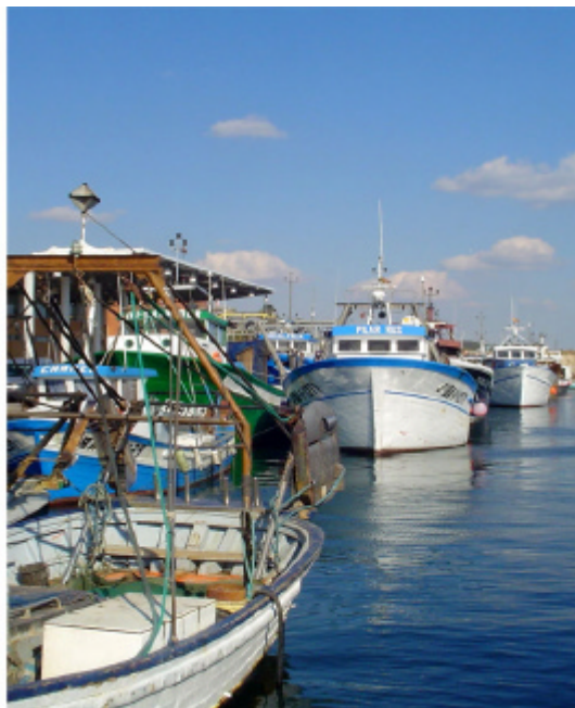
Vaixells de pesca a Vilanova i la Geltrú

Igualment, es proposa continuar la política de millora ambiental dels ports pesquers i l'impuls de la comercialització, renovar les llotges, millorar els processos d'envasat i preparació, i engegar campanyes de promoció. Finalment, es proposa estudiar la viabilitat d'iniciatives que permetin combinar l'activitat pesquera amb el turisme, la qual cosa contribuiria al manteniment d'una part de la flota.