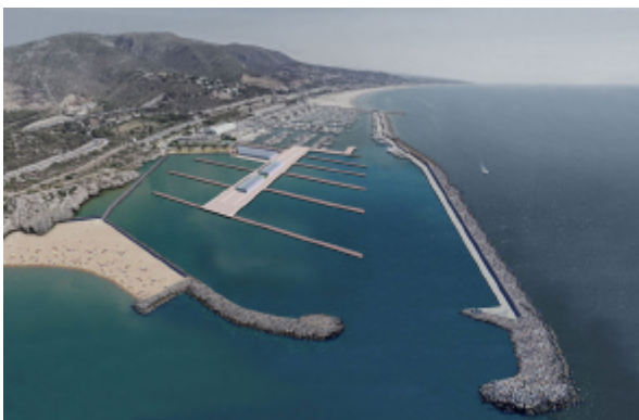
Simulació ampliació Port Ginesta

Una actuació prioritària és la reordenació de les dàrsenes actuals de molts dels ports existents per optimitzar espais i absorbir la tendència a un creixement de l'eslora de les embarcacions esportives