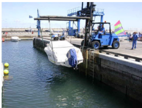
Extracció vaixell aigua