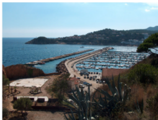
Nova dàrsena esportiva, Sant Feliu de Guíxols

B. Altres instal·lacions. A banda de l'ampliació dels ports esportius, es proposen altres opcions per a la creació de 2.726 noves places, com ara marines seques –magatzems d'on es treuen els vaixells cada vegada que les embarcacions surten al mar--, zones de fondeig controlades –ports naturals— o places d'avarada –rampes que permeten tirar les embarcacions a l'aigua i recollir-les després de navegar--.