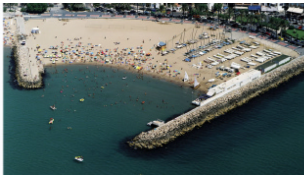
Instal·lació nàutica. La Fragata, Sitges