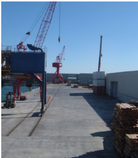
Nou moll Baix a mar, Vilanova i la Geltrú

les instal·lacions al suport pesquer per un import superior als 10,3 milions d'euros.