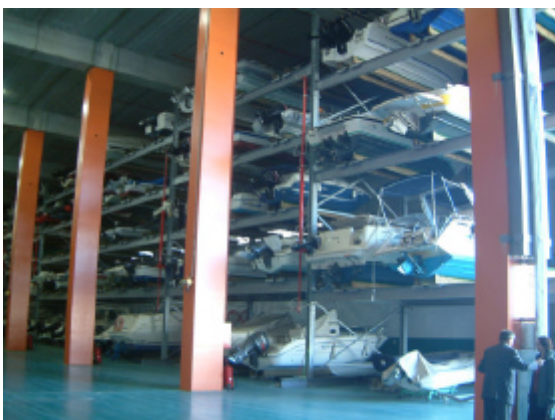
Marina seca, Port Fòrum