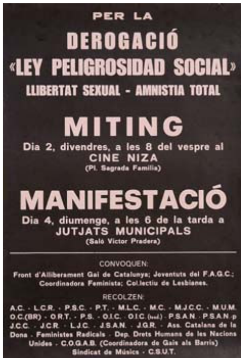
Cartell del míting i manifestació per la derogació de la Ley de Peligrosidad y Rehabilitación Social