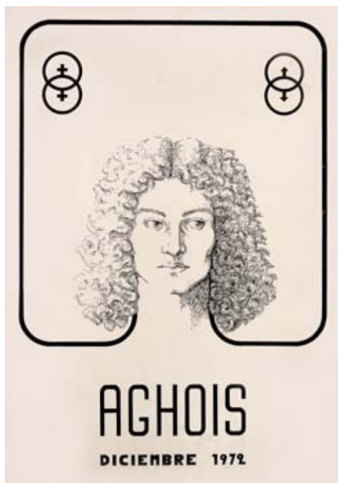
Portada de la revista Aghois (1972)