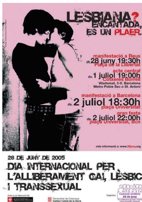
Cartell de la Comissió Unitària del 28 de juny (2005)

Com a fets representatius, destaca el cartell de la primera conferència del FAGC (Front d'Alliberament Gai de Catalunya) de l'any 1979, elaborat només nou mesos després de la despenalització de l'homosexualitat en la Ley de Peligrosidad y Rehabilitación Social o el cartell del míting i la manifestació per a la derogació d'aquesta llei. L'exclusió de l'homosexualitat d'aquesta llei és la primera gran victòria del Moviment a l'Estat.