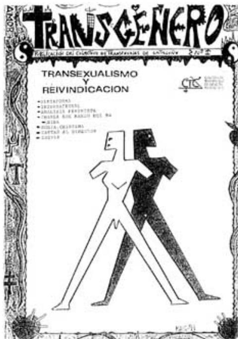
Portada de la revista Transgènere