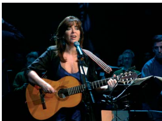
Maria del Mar Bonet