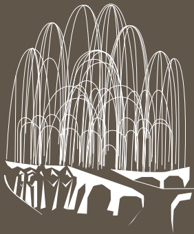
Cripta Colònia Güell