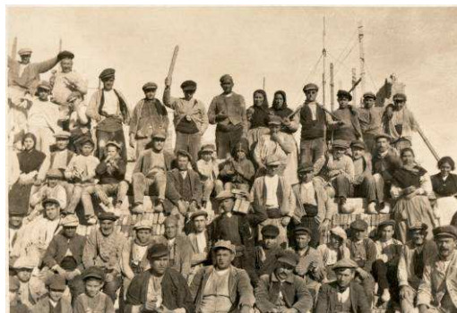
Treballadors i cooperativistes en plena construcció del celler del Pinell de Brai. Autor desconegut. Foto: Arxiu Cèsar Martinell – Museu de Valls

Som a les acaballes del segle XIX. La vinya ha esdevingut omnipresent. Catalunya és el celler de França i del nord d'Europa. La burgesia creix a l'empara d'aquestes exportacions i de la indústria, que està en expansió. Els grans propietaris rurals veuen perillar el seu lideratge. Els mercats agraris inicien el procés de globalització.