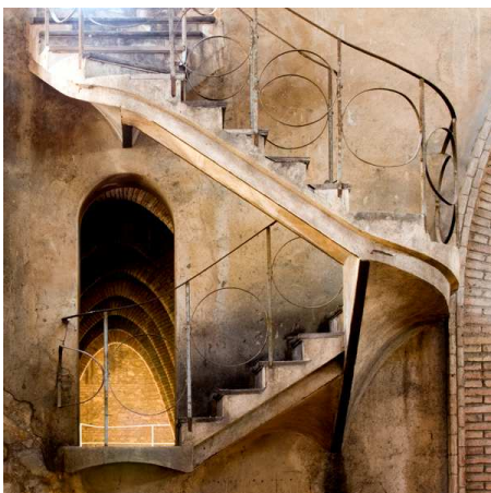
Detall de l'interior del celler del Sindicat Agrícola del Pinell de Brai.

A «En busca de una arquitectura nacional» ( La Renaixensa , 1878), Domènech i Montaner defineix les bases del Modernisme català. La inspiració gòtica n'és una. Finestrals d'aquest estil il·luminen els cellers com mai fins aleshores.