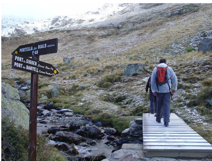
Vall de Sorteny (Andorra)

L'Institut per al Desenvolupament de l'Alt Pirineu i Aran (IDAPA) ve impulsant, des de fa dos anys, jornades tècniques itinerants centrades en el senderisme i en coneixement de les diverses polítiques i eines de gestió de camins. Aquestes trobades combinen la reflexió i l'anàlisi sobre el model de gestió d'un territori en concret amb un viatge d'estudis a un indret amb tradició senderista que disposi d'exemples de referència.