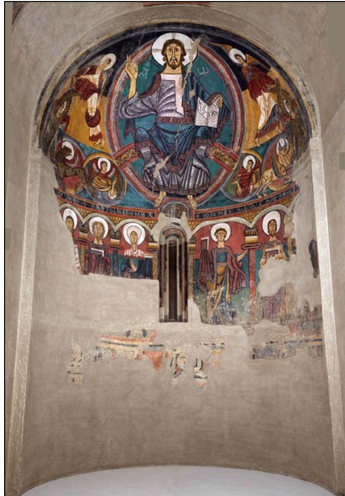
Les pintures de l'absis de Sant Climent de Taüll al MNAC.

Les pintures de l'absis van ser arrencades del seu lloc original i traslladades a Barcelona l'any 1920. Avui les parts més conegudes es poden contemplar al Museu Nacional d'Art de Catalunya (MNAC), mentre que alguns fragments descoberts i restaurats en els anys 2000 i 2001 es conserven en el seu indret original com l'escena de Caïm i Abel o la figura de Sant Climent.