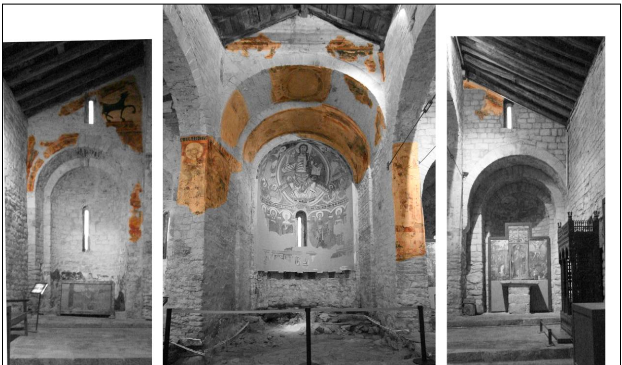
Fragments de pintura romànica original existents a l'església de Sant Climent de Taüll.

El projecte de conservació-restauració intervindrà sobre les pintures murals originals encara existents a la zona de l'absis de l'església de Sant Climent. Aquestes pintures estan situades darrere la reproducció que s'ha exposat fins ara i les restes de decoració situades al peu dels murs laterals del presbiteri. Les capes que ara es recuperaran constitueixen una troballa excepcional, que permetrà relacionar directament la pintura amb l'entorn arquitectònic, situar correctament les pintures arrencades, i determinar la composició dels morters originals.