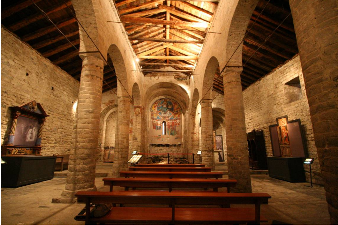
Estat actual de l'església de Sant Climent.

Es tracta d'una edificació de planta basilical de tres naus. Els murs de l'església són de granit. Els arcs de les finestres s'utilitza pedra tosca per la decoració, que consisteix en elements d'estil llombard. El campanar de torre és de planta quadrada, compost per un sòcol alt i sis nivells d'altura.