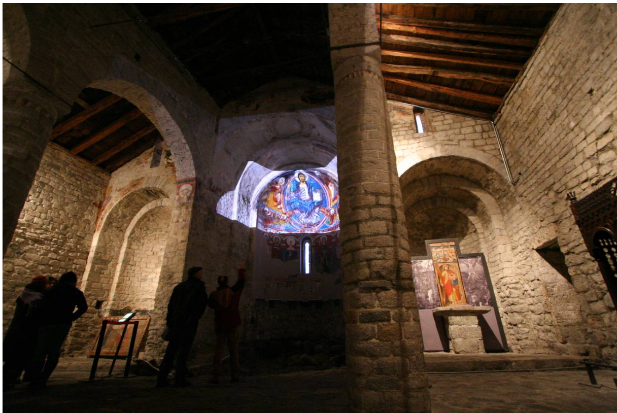
Proves de projecció a Sant Climent de Taüll.

La presentació d'aquests estadis es farà de forma cronològica i la seva aparició permet mostrar dos conceptes cabdals de la pintura: el seu procés i el seu significat.