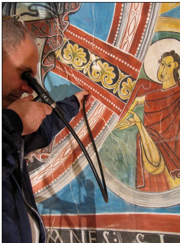
Sondatges darrera la còpia dels anys 60.

Per tal d'assolir aquests objectius es retirarà prèviament la reproducció de les pintures murals de l'absis, obra de l'artista Ramon Millet, que va ser realitzada i instal·lada a l'església a principis de la dècada de 1960. Es tracta d'una estructura de diversos plafons de fusta i guix, pintada i molt degradada, que se superposa al mur antic amb restes pictòriques romàniques que no les deixa veure. Un cop extreta serà conservada pel seu valor documental.