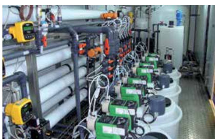
Diseño, fabricación y montaje de un equipo de ósmosis inversa de doble paso para el tratamiento de las aguas de la central térmica Nairobi South (Kenia).