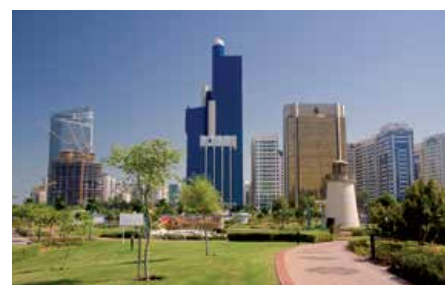
Gestión integrada de proyectos de modernización de infraestructuras y edificios públicos en Abu Dhabi, Emiratos Árabes.