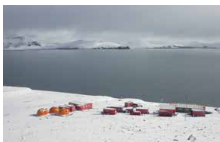
Consultoría técnica, dimensionamiento y suministro de depuradora de aguas residuales en la base científica de España ubicada en la Antártida y gestionada por el Ministerio de Defensa.