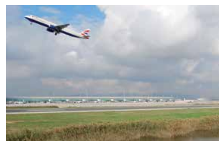
Trabajos para la prevención de impactos sobre la fauna y la reducción de riesgos para la seguridad aeronáutica de un nuevo aeropuerto internacional en el sur de Costa Rica.