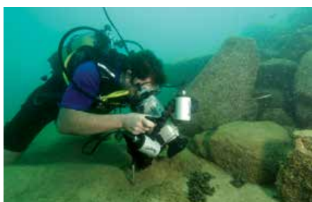
Guía de caracterización de ecosistemas marinos para la evaluación ambiental (Servicio de Evaluación Ambiental del Gobierno de Chile).