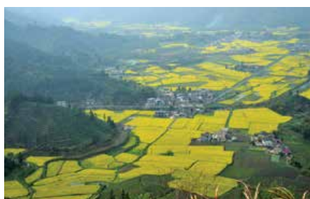
Análisis de oportunidades y retos de la Compra Pública Verde para el crecimiento y comercio sostenible en la Región de Asia-Pacífico, APEC (Asian Pacific Economic Cooperation).