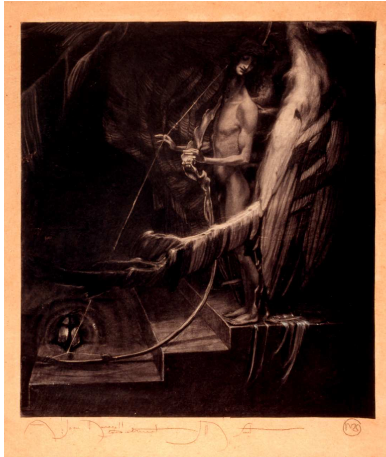
Parsifal. Josep M. Sert, gravat, c. 1900.

L'exposició, que té lloc en el marc de la celebració del Bicentenari del naixement de Richard Wagner i del centenari de l'Institut del Teatre, es divideix en tres àmbits principals: un espai inicial que ens situa en l'època i ens ofereix una sintètica representació del wagnerisme artístic europeu; un segon àmbit que aprofundeix en la repercussió de l'obra de Wagner en la segona generació de modernistes catalans; i un tercer, dedicat a Gual i els plafons de l'Associació Wagneriana, que per primera vegada mostraran la decoració completa d'aquest saló de música.