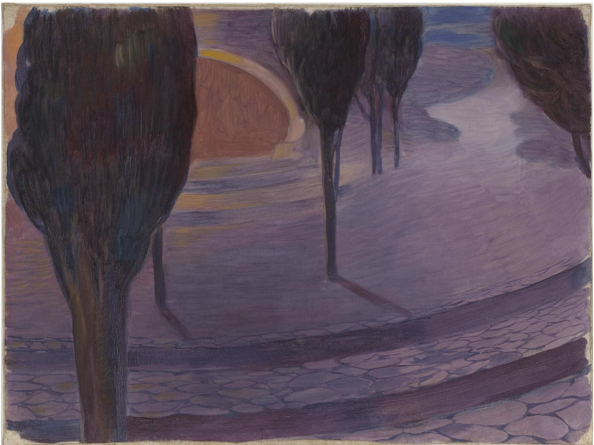
Lloc de trobada , Tristan und Isolde , acte II. Adrià Gual, pintura que decorava la seu de l'Associació Wagneriana, c. 1903-04. Biblioteca de Catalunya

L'acte segon l'exemplifica amb dues obres més: Espera en el castell del rei Marke , un jardí amb arbres molt alts sobre l'estança d'Isolda, on centra tot el protagonisme en la gran escalinata que condueix Isolda al jardí de l'amor, potser l'obra més escenogràfica de totes les del conjunt; i El lloc de trobada , que uneix els dos amants.