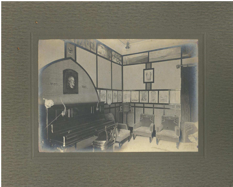
Fotografia interior de la seu de l'Associació Wagneriana, Biblioteca de Catalunya.