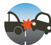
Accidents amb Morts a 24 hores.

Entre l'1 de gener i el 31 de desembre de 2013 la xarxa viària interurbana de Lleida ha registrat 27 accidents mortals amb 30 morts a 24 hores . Això representa el decrement més accentuat de Catalunya de les víctimes mortals respecte de l'any anterior amb un 36,17% , quan hi van haver 47 morts.