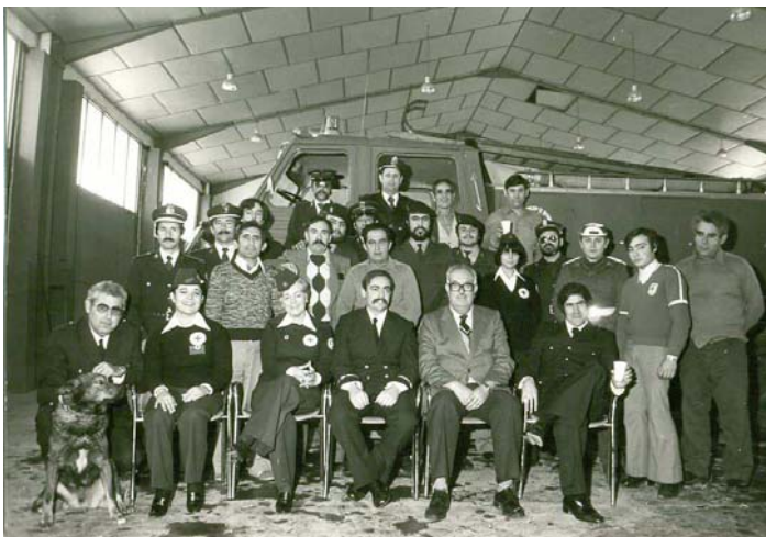
Celebració de Sant Joan de Déu (1980)

Generalitat de Catalunya Departament d'Interior Direcció General de Prevenció, Extinció d'Incendis i Salvaments Àrea d'Informació i Comunicació