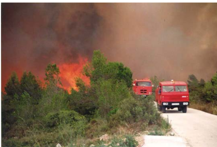
Incendi forestal a les Gunyoles al juliol de 1997

Cerdanyola del Vallès, 10 de març de 2014