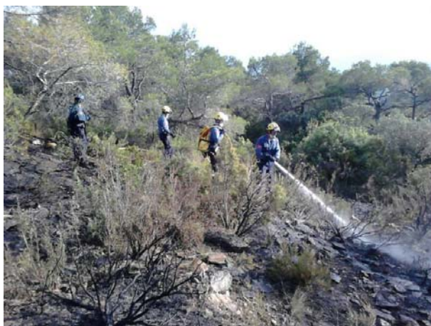
Bombers de la Generalitat a l'incendi de la Figuera, el juliol de 2013

Habitualment és durant els mesos d'estiu, en què el nombre de serveis per incendis de vegetació augmenta d'una manera destacada. Al 2013 però, la campanya d'incendis forestals de l'estiu es va caracteritzar per una climatologia amb temperatures moderades i lleugerament plujosa que no va complicar la situació. En la gràfica adjunta es pot veure que al juny va haver un pic en els incendis de vegetació urbana, però corresponen a l'elevat nombre de serveis fets amb motiu de les revetlles de Sant Joan;