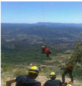
Bombers de la Generalitat en un rescat a Cornudella de Montsant, l'agost de 2013

En el cas dels serveis de rescat al medi natural, els bombers han tingut un lleuger augment en el nombre d'actuacions. Si bé, l'augment respecte el període 2012 és força baix, és important destacar-ho perquè en aquest àmbit la tendència segueix a l'alça. Cada vegada hi ha més persones que realitzen activitats d'esport i lleure a l'aire lliure.