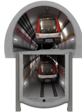
Túnel en mina

En paral·lel al nou tram, entraran en explotació 6,3 quilòmetres –3,3 km en túnel i 3 en viaducte– del ramal de Zona Franca per tal que els trens puguin accedir a la zona de tallers i de dipòsit.