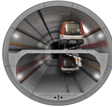
Túnel diàmetre 12m