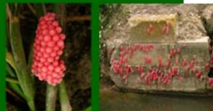
◀ Postes d'ous / puestas / eggs laying

Eviteu-ne la dispersió Evitar su dispersión Avoid dispersal