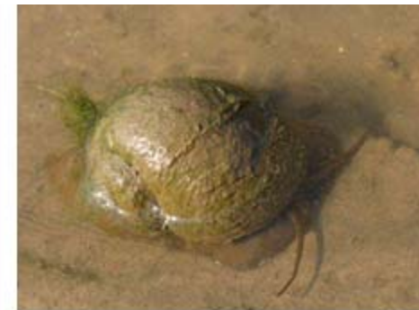
▲ Adult / adulto