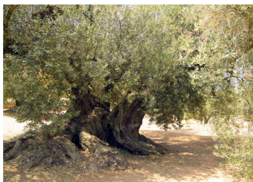
Olivera monumental a Ulldesona