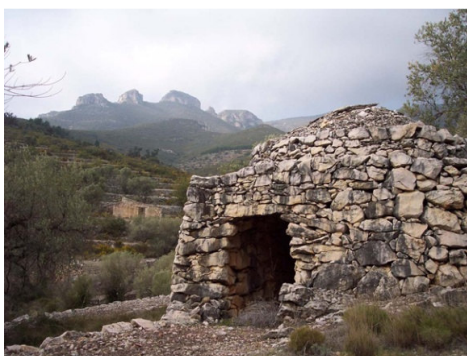
Cabana de pedra en sec als Ports