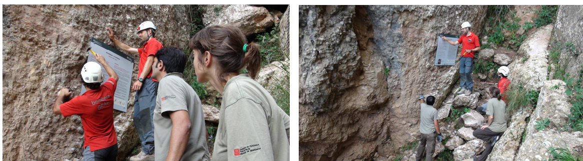
Imatges durant la col·locació, la setmana passada, del cartell al peu de la via ferrada "La Teresina"

Aquests plafons recorden la dificultat de l'activitat, la preparació tècnica i física requerides per a dur-la a terme, així com els consells bàsics de seguretat o quin ha de ser el material necessari i les directrius a seguir per fer un ús correcte de la via.