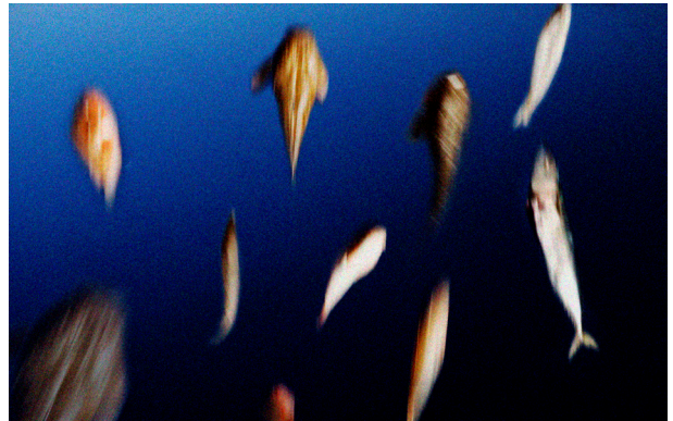
La Ira dels Peixos—Teatre