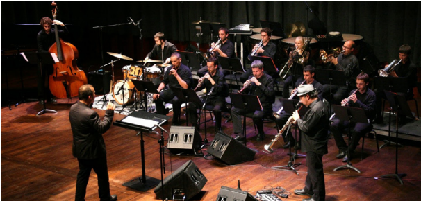
Cobla de l'ESMUC—Sardanes