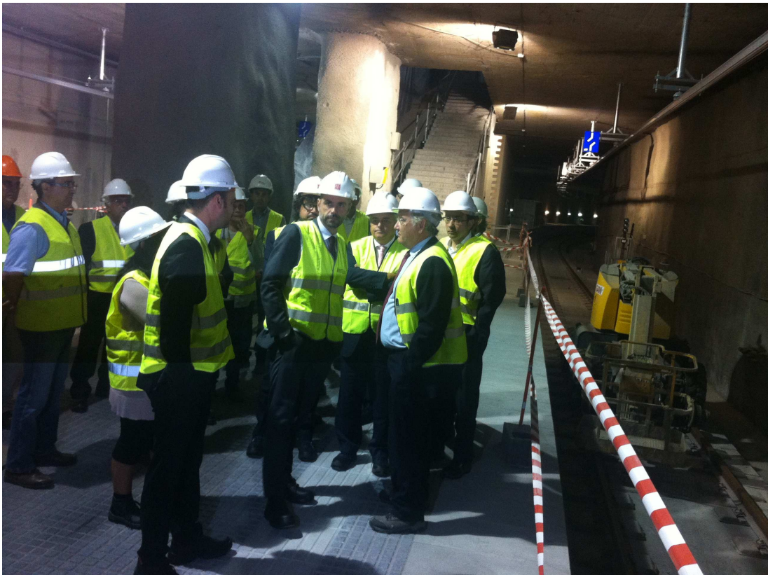
El conseller Vila –al centre- a l'andana de l'estació en obres Vallparadís Universitat de Terrassa.

El conseller de Territori i Sostenibilitat, Santi Vila, ha anunciat avui que les obres del perllongament de Ferrocarrils de la Generalitat (FGC) a Terrassa estaran acabades la primavera i que tota la línia estarà funcionant l'estiu vinent. Vila ho ha assegurat durant una visita a l'estació de Vallparadís Universitat, una de les tres que estan actualment en construcció dins de les obres de perllongament del Metro del Vallès.