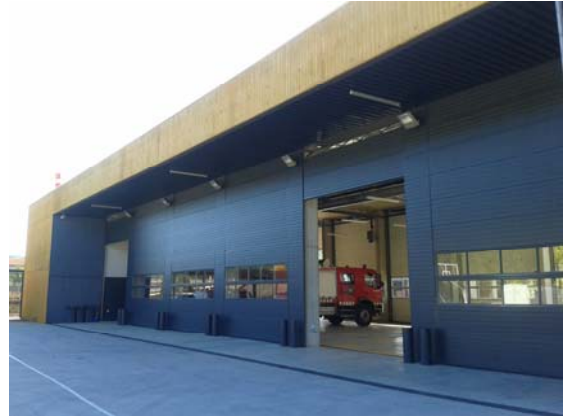
Exterior de les cotxeres a la façana posterior