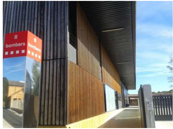
Façana del nou Parc d'Olot