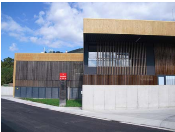
Façana principal del parc de Bombers d'Olot