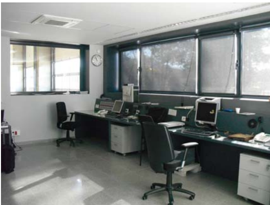
Sala de control del Parc