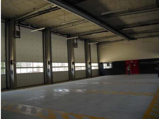
Aspecte general de les cotxeres del nou Parc