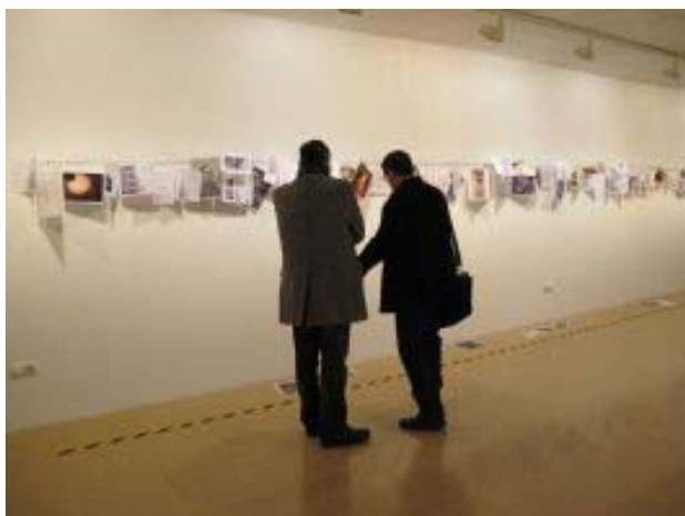
Exposició Estratègies de la precarietat a ACVic (2013)