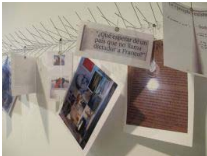
© Francesc Abad / Les costelles del segle (2011 – en procés)

També, com assegurava Hannah Arendt, un altre dels seus puntals més persistents: “No tinc intenció de fer carrera, ni per convicció, ni per capacitat.”