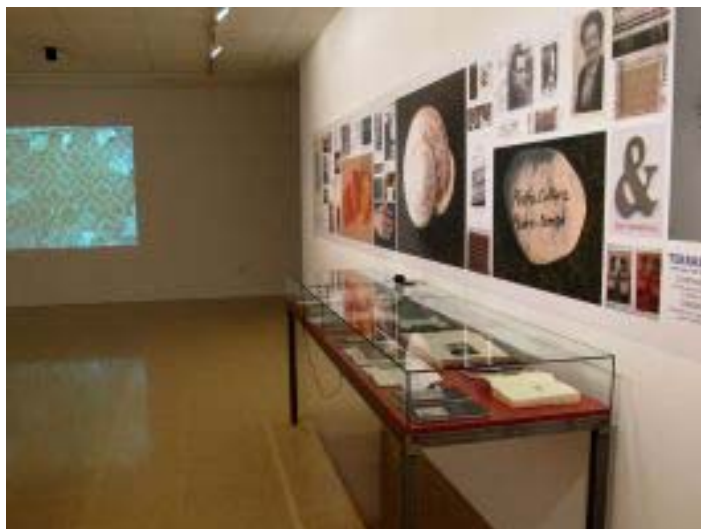
© Francesc Abad / Diaris del pensar (en procés)

La seva activitat artística es construeix i es reconeix com una reflexió cultural articulada en forma d'imatges dialèctiques, centrada en la fragilitat de l'home, el paisatge i la paraula, el pas del temps i el pes de la memòria, l'agonia industrial i la progressió històrica, el final de mons que s'acaben, l'exili i el dolor, configurant una particular escriptura dels límits que prioritza clarament el compromís personal i la recerca social per damunt de la qualitat estètica i el caràcter objectual. Una reflexió, en definitiva, molt útil també per repensar els esdeveniments socials i polítics amb els quals s'ha anat determinant la història del segle XX.