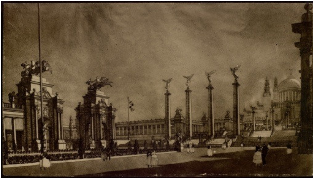
Llapis i carbó de Puig i Cadafalch "Perspectiva de la plaça de Catalunya", 1923. ANC

Partint d'aquesta base de la modernitat, la mostra fa una radiografia de l'estat actual del territori des del punt de vista de la percepció de les persones sobre el seu entorn, sobre el paisatge que s'ha codificat, sobre l'estructura de ciutats i les infraestructures, n'aborda els reptes actuals i esbossa el nou paradigma que s'endeuina pel futur, centrat en una nova relació entre la persona i el seu entorn, entre el fet urbà i el rural. És, doncs, una exposició amb una visió positiva, que aposta per un nou punt de vista cap el futur que obre un gran ventall de possibilitats i oportunitats.