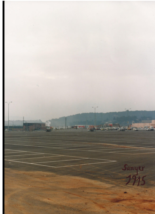
Fotografia "Sunyer", de Perejaume