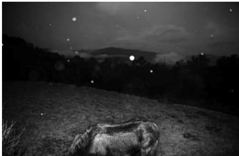
“La fi dels dies”, fotografia de Yurian Quintanas

3- Llums i ombres de la modernitat: La ciutat com a estructura hegemònica d'organització de la humanitat a nivell mundial posa sobre la taula un seguit de reptes. Així per exemple, es tracta l'efecte homogeneïtzador de la globalització, la viabilitat futura de les ciutats, les dinàmiques de degradació internes i la proliferació de suburbis inhòspits al voltant de les urbs.