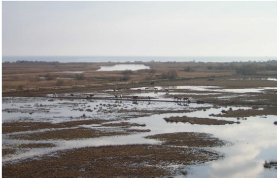
Aiguamolls de l'Empordà, valor natural de les Comarques Gironines

El paisatge d'aquestes comarques el conformen 10 trets principals: els penya-segats del litoral, les valls, el mosaic agroforestal, les masies i construccions rurals, els paravents, els patrons d'assentaments i nuclis de població singulars, els fons escènics, les infraestructures i la urbanització de la façana litoral.