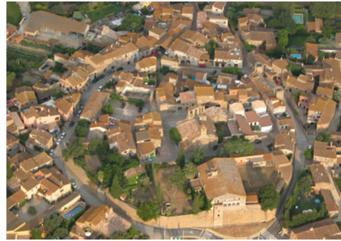
Ullastret, patró d'assentaments de l'Empordanet

El Catàleg divideix l'àrea de les comarques gironines en 26 unitats de paisatge i proposa un conjunt d'objectius de qualitat paisatgística específics per a cadascuna.