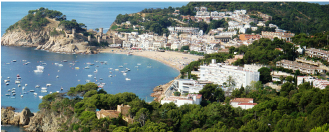
Vista panoràmica del paisatge litoral de Tossa de Mar