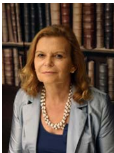
Carme Riera Palma de Mallorca, 1948