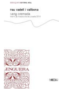
Sang cremada , Editorial Moll

Premi Literari Vila de Lloseta de Poesia.