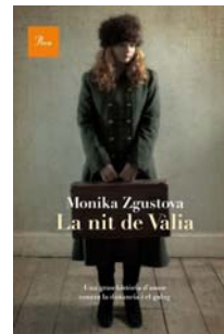
La nit de Vàlia , Editorial Proa.