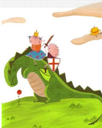
Il·lustració Lydia Fortuna