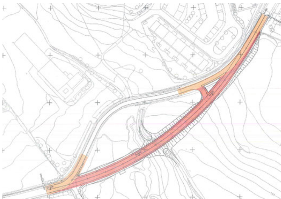
En vermell, la variant de traçat

L'obra que ara s'adjudica s'emmarca en un conveni signat recentment entre Territori i Sostenibilitat i l'Ajuntament de Sant Sadurní d'Anoia per a la millora i traspàs del Departament al municipi d'un tram de la C-243a perquè s'integri a la xarxa urbana, atès que ha perdut la seva funcionalitat com a carretera. El tram que es traspasarà, que s'inicia a la rotonda entre el carrer Sant Quintí i la Rambla de la Generalitat i inclourà la variant projectada, té una longitud total d'uns 700 metres.