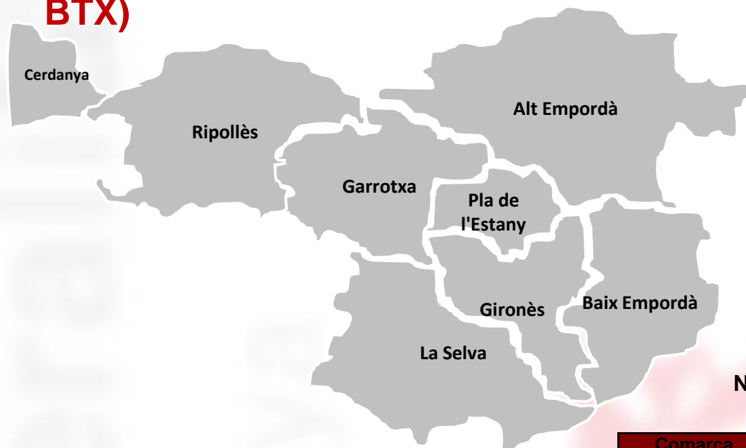
Nombre d'increments d'oferta postobligatòria