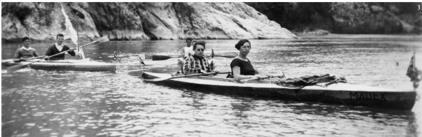
Fotografies: 1. Ciclistes al velòdrom de Sants. Gabriel Casas. ANC / 2. Vista sobre el circ de Lyds, des de Puylané. 1912. Emili Juncadella. Diputació de Barcelona / 3. Baixada per l'Ebre, 1929. Arxiu Comarcal del Baix Ebre.