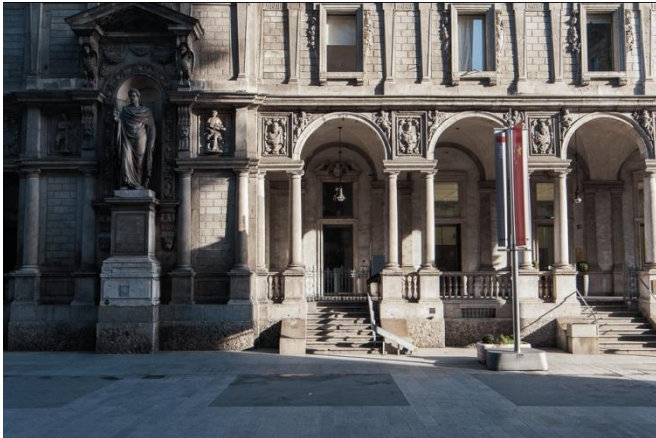
Porxos o «Loggiato»