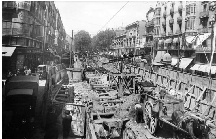
Obres del Gran Metro a la Rambla de Barcelona

El conseller de Territori i Sostenibilitat, Santi Vila, ha inaugurat avui a la seu del Col·legi d'Arquitectes de Catalunya (COAC), a la plaça Nova de Barcelona, un audiovisual que, amb la tècnica del mapatge, mostra les diverses etapes de la construcció de la xarxa metropolitana de metro. Precisament, l'any passat es va celebrar el 90 aniversari de la posada en servei del primer tram del Gran Metro de Barcelona.