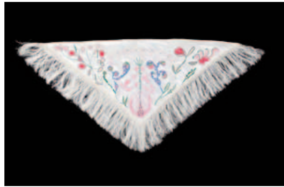
Josefa Tolrà. Mocado blanc brodat B