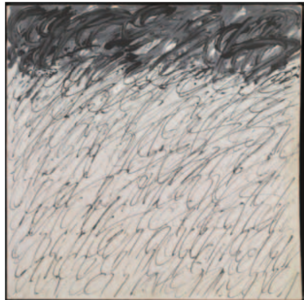
Joaquim Chancho. Espai gestual 2 , 1974. Museu d'Art Contemporani Barcelona (MACBA)