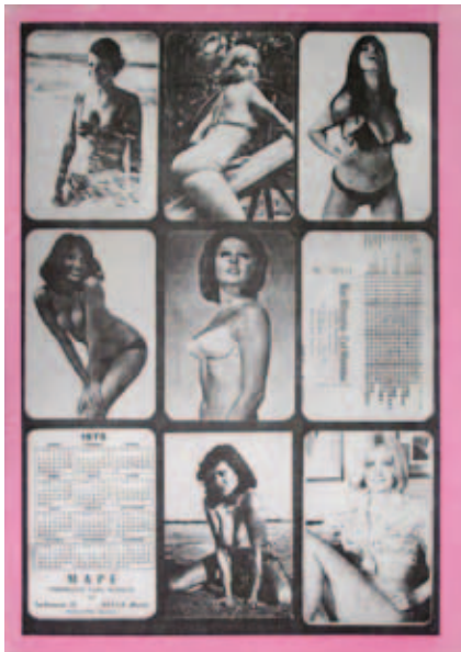
Pere Noguera. La fotocòpia com a obra-document , 1971. Museu d'Art Contemporani Barcelona (MACBA)