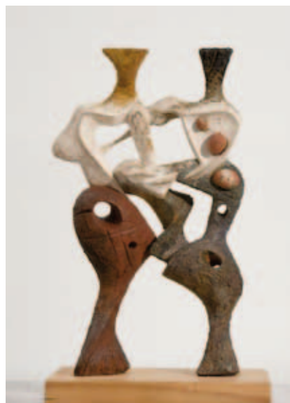
Angel Ferrant. Noies entrelaçades , 1952. Museu Nacional d'Art de Catalunya