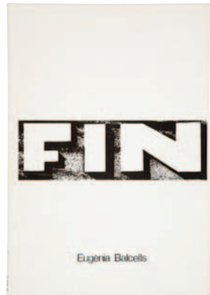
Eugènia Balcells. Fin , 1977. Museu d'Art Contemporani Barcelona (MACBA)

S'aprecia un notable increment dels espais expositius, sobretot les galeries (Joan Prats, Cent, Mec Mec, Trece, G, Sala Aixelà, Eude, 49, Maeght, Galeria Cadaqués, etc). La Sala Trece, a Sabadell, i sobretot la Sala Vinçon, un veritable meeting point per a l'època, certifiquen l'activitat artística d'aquests anys que són, també, els de l'aparició de diverses revistes contraculturals com Ajoblanco , El Rollo enmascarado i Star ; d'humor satíric, com El Jueves i Por Favor ; o de pensament polític, com El Viejo Topo .