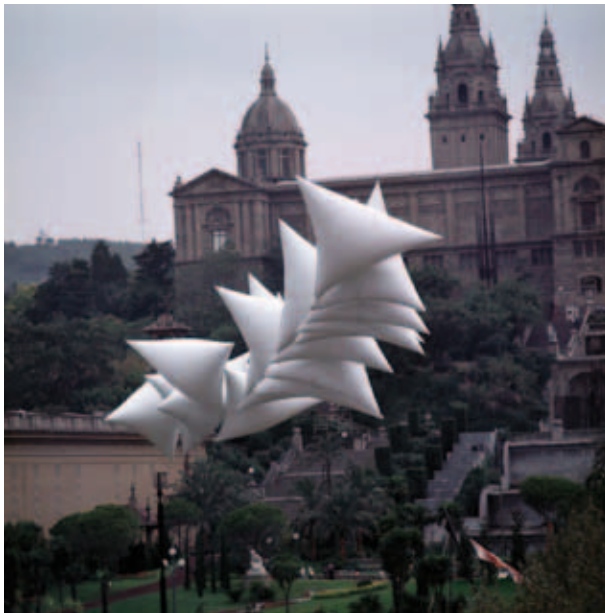
Josep Ponsatí. Barcelona, 1977 . Museu d'Art Contemporani de Barcelona (MACBA)

L'exposició complementa i perllonga cronològicament la nova presentació d'art modern de la col·lecció del museu, tot prefigurant una possible permanent que abastaria fins a finals de la dècada de 1970, i al mateix temps, assenyala, també, visions monogràfiques futures.