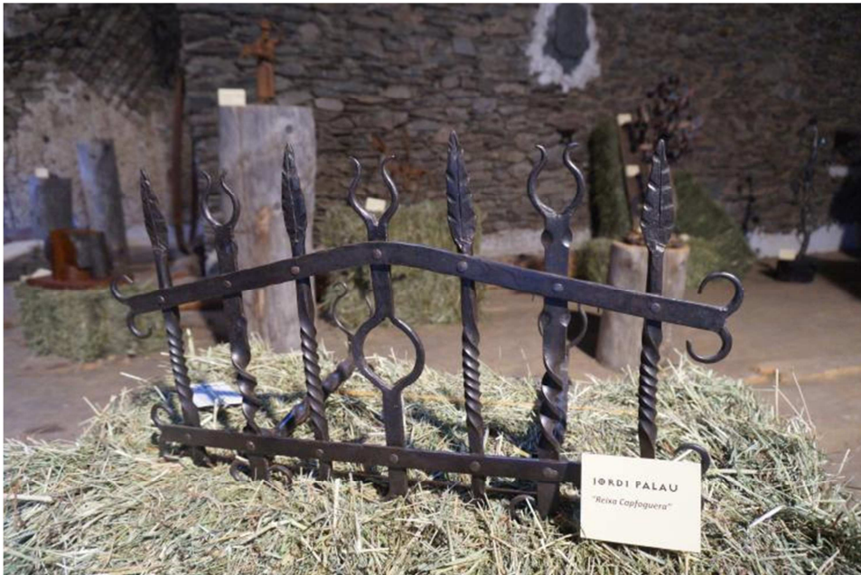
Exposició de peces de forja al paller de Casa Coix d'Alins. Marc Garriga.