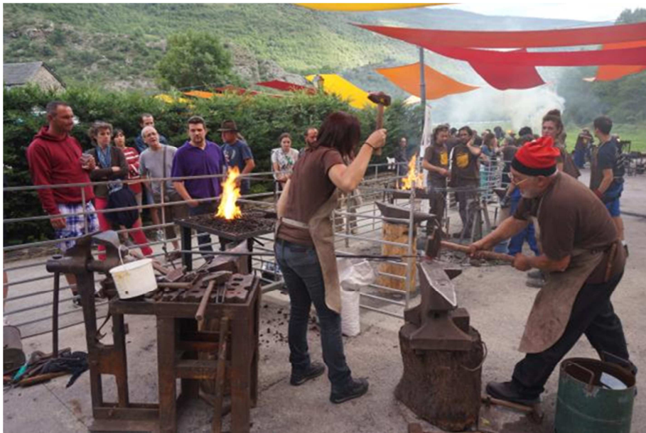
Forjadors demostrant el seu ofici, durant la passada edició. Marc Garriga.

Enguany el fil conductor de la fira serà l'ús tradicional de la forja a la llar. S'hi faran exposicions, visites guiades i obres de teatre relacionades amb aquest tema. Els forjadors participants crearan en viu més de 35 banderoles de forja, cadascuna amb l'estil personal de cada parella de forjadors, i que serviran per guarnir les façanes de les cases dels pobles de la Vall Ferrera amb els noms tradicionals de cada llar. Es preveu que cada casa beneficiària aportarà una donació econòmica fixa a la Fira, que ajudarà a millorar-ne el finançament.