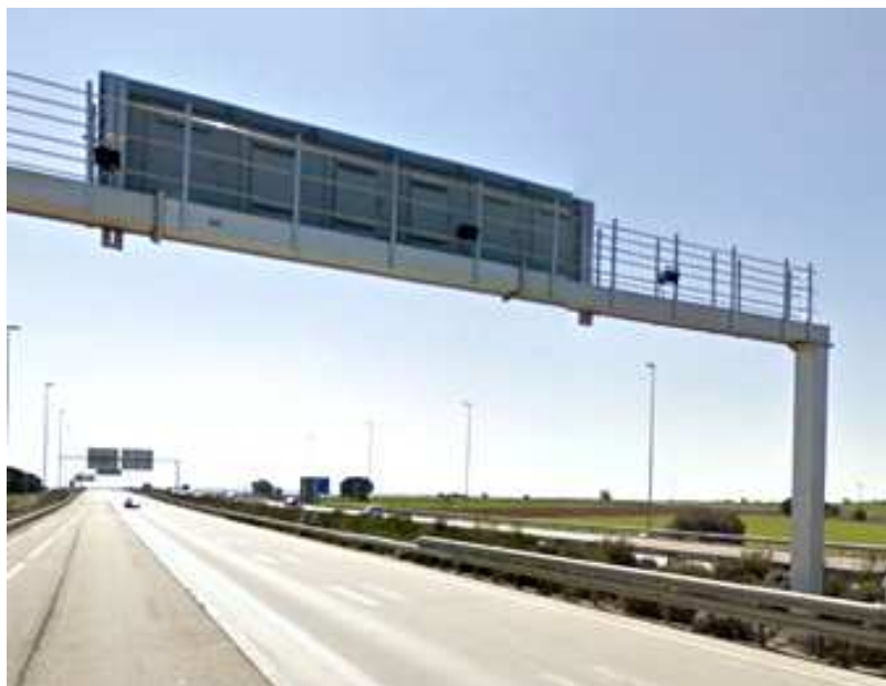
El sistema de peatge tancat virtual comporta la instal·lació de pòrtics com el de la fotografia