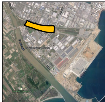
Emplaçament: antiga llera del Llobregat