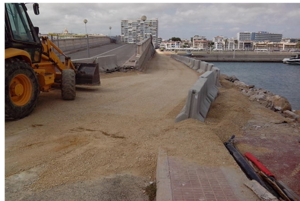
Camí provisional d'accés rodat al port

Cal tenir present que es troba en licitació un nou concurs de gestió de servei públic per la concessió del port de Coma-ruga, que garantirà una gestió adequada de la infraestructura durant els propers 20 anys. El termini de presentació d'ofertes finalitzarà el proper 7 de setembre.