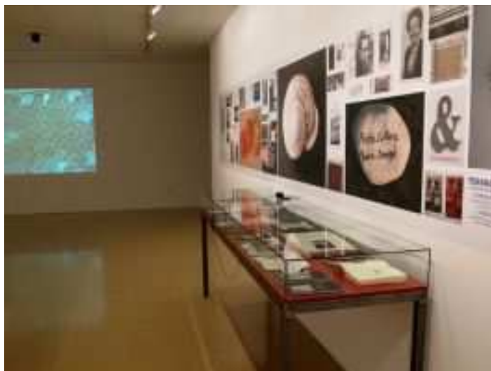
© Francesc Abad / Diaris del pensar (en procés)

La seva activitat artística es construeix i es reconeix com una reflexió cultural articulada en forma d'imatges dialèctiques, centrada en la fragilitat de l'home, el paisatge i la paraula, el pas del temps i el pes de la memòria, l'agonia industrial i la progressió històrica, el final de mons que s'acaben, l'exili i el dolor, configurant una particular escriptura dels límits que prioritza clarament el compromís personal i la recerca social per damunt de la qualitat estètica i el caràcter objectual. Una reflexió, en definitiva, molt útil també per repensar els esdeveniments socials i polítics amb els quals s'ha anat determinant la història del segle XX.