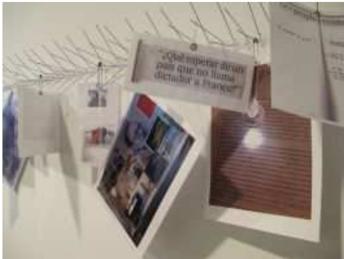
© Francesc Abad / Les costelles del segle (2011 – en procés)

També, com assegurava Hannah Arendt, un altre dels seus puntals més persistents: “No tinc intenció de fer carrera, ni per convicció, ni per capacitat.”