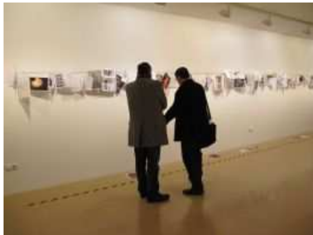
Exposició Estratègies de la precarietat a ACVic (2013)