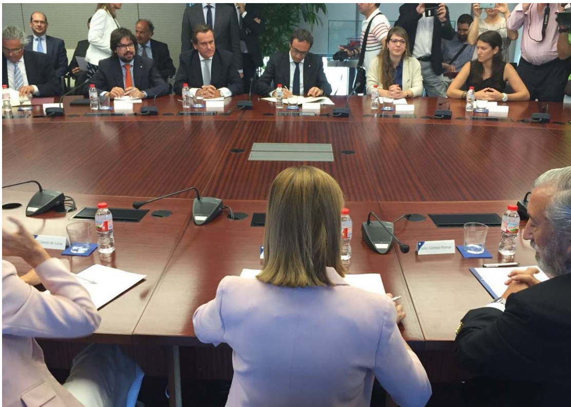
Moment de la signatura del conveni, aquest dimarts.