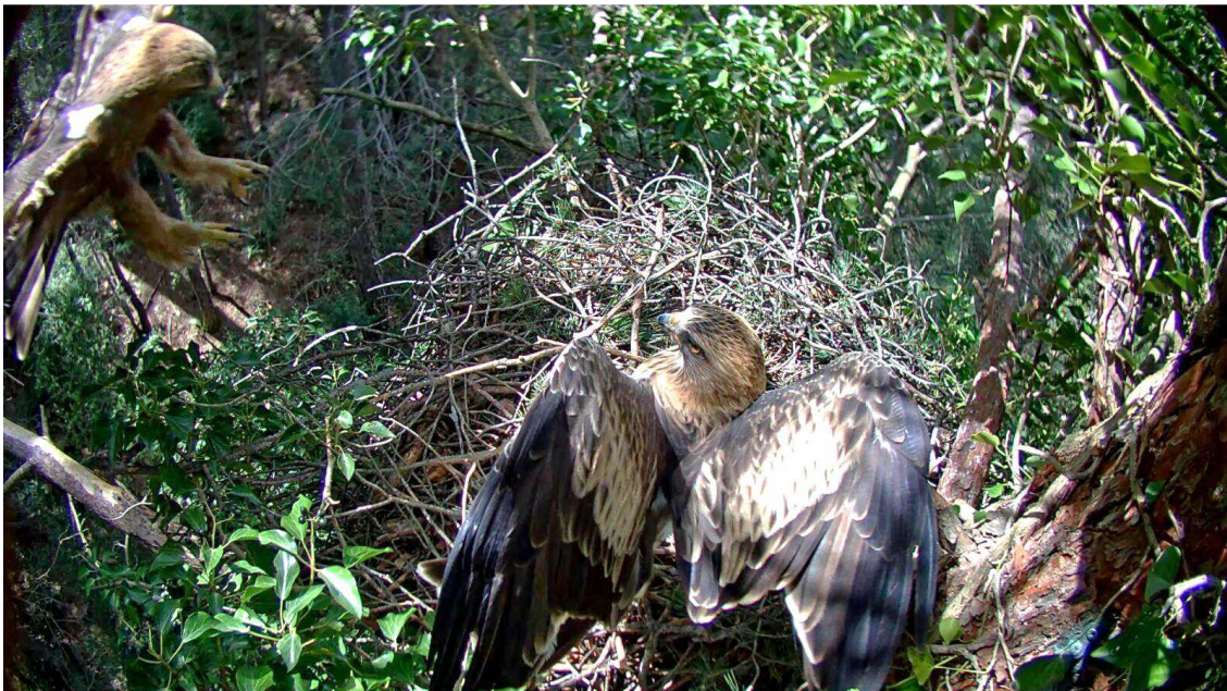
Parella d'àguiles calçades al niu, des de la càmera web.

L'àguila calçada ( Aquila pennata ) és un rapinyaire forestal que viu als boscos de la zona alta dels Ports, on un total de 15 parelles nidifiquen en rodals de bosc de pinassa i de pi roig ben conservats de l'interior del Parc Natural dels Ports. Es tracta d'una espècie protegida i d'interès comunitari inclosa a l'Annex I de la Directiva Aus, és a dir, objecte de mesures especials quant a la conservació dels seus hàbitats.