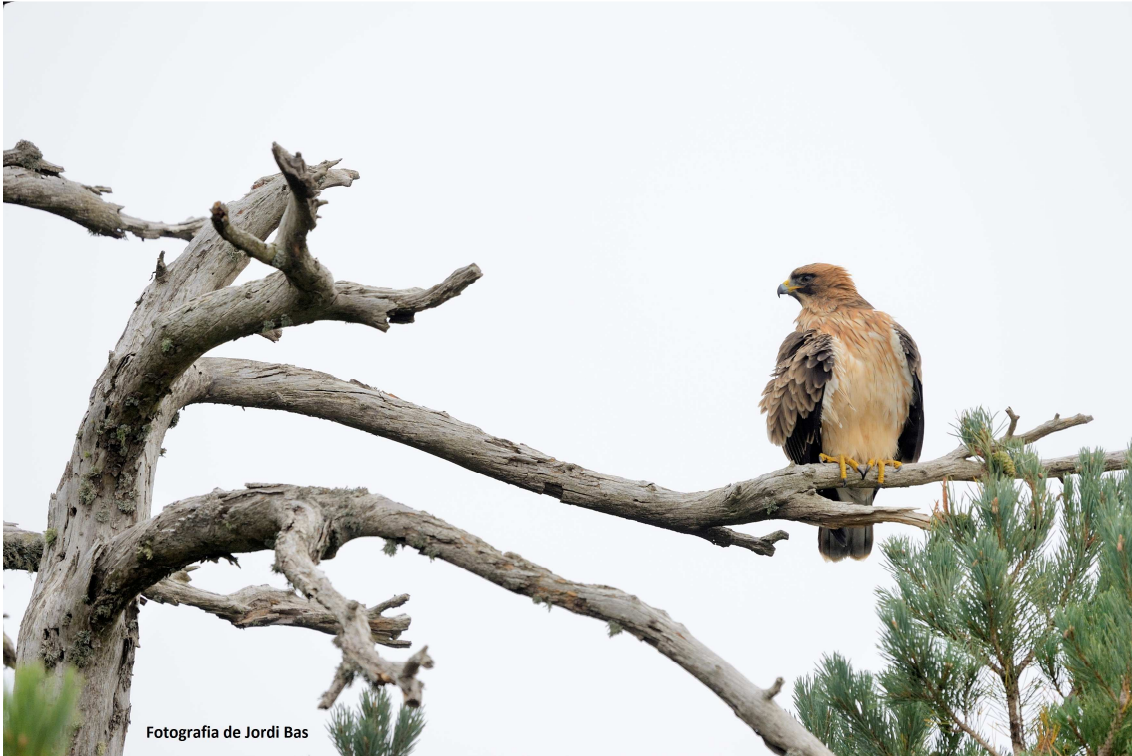
Aguila calçada, fase clara.

Per evitar molèsties a la reproducció, la instal·lació de la càmera es va realitzar a finals del mes de febrer, quan les àguiles encara no havien arribat a les zones de nidificació. Aquesta és una espècie migradora, i la major part de la població hiverna al sud del Sàhara. L'accés al niu es va realitzar amb la col·laboració del grup de Suport de Muntanya del Cos d'Agents Rurals.