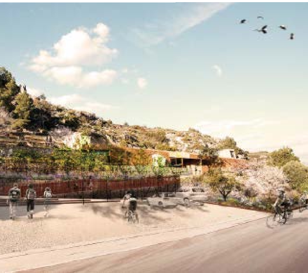
Renders del projecte d'adequació d'accessos de la Roca dels Moros del Cogul