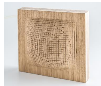
Inflatable Wood, d'Arca, de fusta inflable

Un nombre creixent d'investigadors i creadors estan desenvolupant materials diversos a partir de sistemes vius, i plantegen un model de cooperació amb la natura alternatiu a l'explotació. Organismes com els fongs o els bacteris són els actors clau d'una prometedora metodologia de producció, Do It Yourself («fai-ho vostè mateix»), que, imitant els cicles naturals, planteja un sistema circular, tancat i eficient.