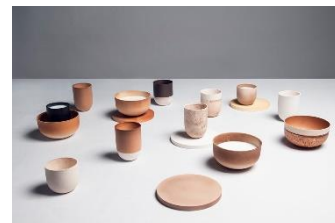
Care for Milk, d'Ekaterina Semenova, realitzat amb esmalt ceràmic obtingut de residus lactis

Posant els processos de transformació al servei de la imaginació es poden aconseguir tota mena de solucions singulars que reformulen la percepció que tenim dels materials més universals.