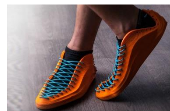
Sneakers II, de Recreus, realitzat amb impressió en 3D amb materials flexibles