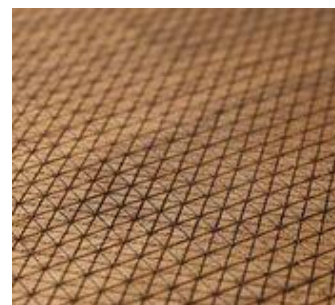
Ligneah, de Mymantra, realitzat amb teixit de fusta