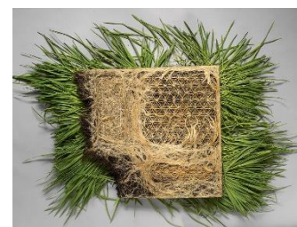
Interwoven, de Diane Scherer, realitzat amb patrons vegetals