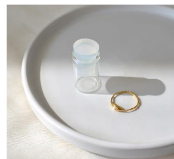
What's in a tear?, de Merle Bergers, realitzat amb pedres fabricades a partir de llàgrimes