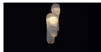
The Meat Project, d'Isaac Monté, realitzat amb carn descel·lularitzada