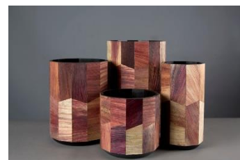
Totomoxtle, de Fernando Laposse, de xapa de fulles de blat de moro

En un moment en el qual comencem a ser conscients del veritable valor (i fragilitat) d'aquesta riquesa material, les iniciatives que proposen una nova relació amb els recursos vegetals estan desenvolupant un ampli ventall de materials alternatius amb un gran potencial d'aplicació en l'artesania.